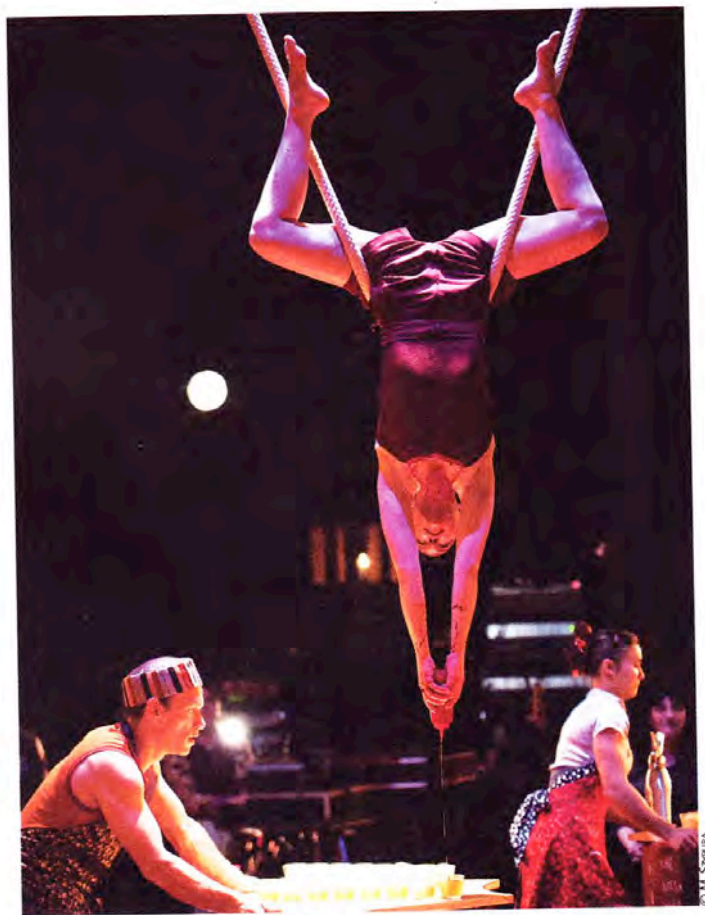
► Le Repas , du Cheptel Aleikoum, un cabaret participatif sous le chapiteau du Village de cirque.