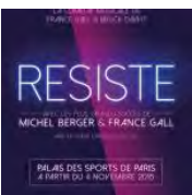
Résiste : la comédie musicale débarque au Palais des Sports de Paris en [...]