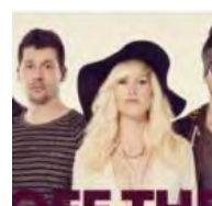
Walk Off The Earth en concert à l'Olympia f 1