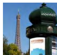
Que faire pour le Pont et week-end de l'Ascension 2015 à Paris ?