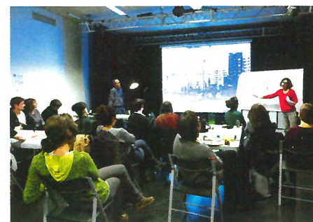
L'après-midi de travail a commencé dans les rues de Paris Rive Gauche où chacun était invité à noter ses impressions. En clôture, un atelier de restitution au Centre René Goscinny a permis les échanges pour aboutir à une synthèse.