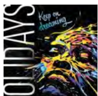
Solidays 2015 à l'Hippodrome de Vincennes f 1