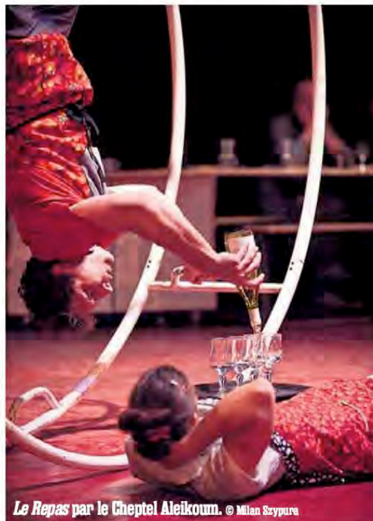
Le Repas par le Cheptel Aleikoum.

C'est le festival francilien que tous les férus de cirque de création attendent. Avec cette onzième édition, le Village de Cirque s'affirme plus que jamais comme un espace unique, porteur d'utopie, un lieu de partage nécessaire où se croisent tous les publics avides d'y découvrir une programmation exigeante et défricheuse. En bref, le lieu de la recherche et de la création sous chapiteau à Paris. Au menu : deux semaines de rencontres et d'imaginaire (sous l'égide de la Coopérative de Rue et de Cirque) truffées d'univers forts, hors carcans. À commencer par Le Repas , un cabaret-banquet circassien mitonné par le Cheptel Aleikoum, mais aussi ParasiteS des intrépides Galapiats, Slow Futur , la dernière création du cirque Bang-Bang (jonglage hypnotique sur tapis roulant) ou encore Otradnoie. 1 , un numéro de suspension capillaire délivré par les Catalans du Proyecto Otradnoie. Sans oublier la Carte Blanche à l'Académie Fratellini avec deux pièces de cirque tout en poésie : Inbox , présenté par deux déménageurs de l'absurde, précédé par la toute nouvelle création d'une figure incontournable du jonglage, Jérôme Thomas. Les amateurs de formats courts ne seront pas en reste avec Emois et Trois fois rien , deux petites formes en chantier du CirkVOST ou les équilibres précaires de Kati Wolf. Et avec tout