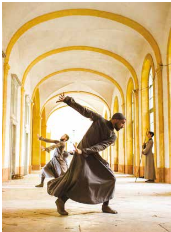
► La Figure du gisant , un spectacle de danse en plein air.