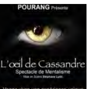
Le mentaliste Pourang au Funambule Montmartre : gagnez vos places !