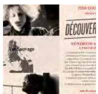
Les soirées Découvertes chez Ma Cocotte