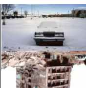
Soeurs, de Wajdi Mouawad au Théâtre National de Chaillot : notre critique